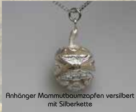
Anhänger Mammutbaumzapfen versilbert mit Silberkette