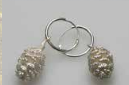
Ohrringe Erlenzapfen versilbert Creolen echt Silber (925er)