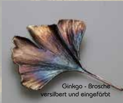
Ginkgo - Brosche versilbert und eingefärbt