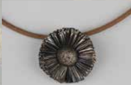
Tausendschönchen versilbert und eingefärbt