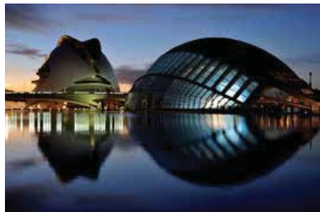
Nachtfotografie